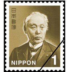
図 2. 前島密